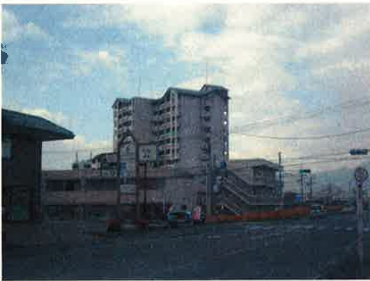
(県道陶湯田線より撮影)