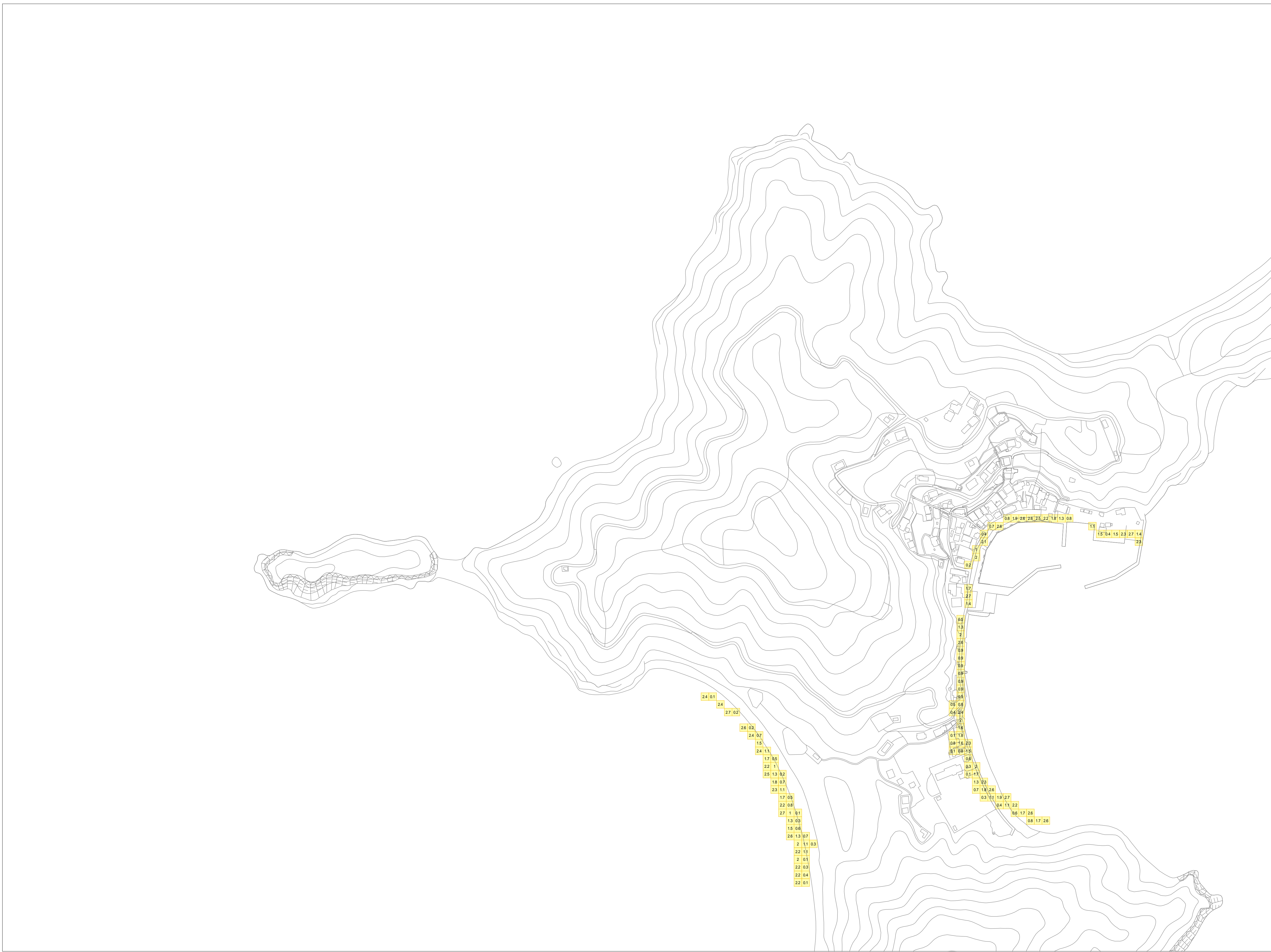
この地図は、岩国市長の承認を得て岩国市都市計画図を使用したものである。