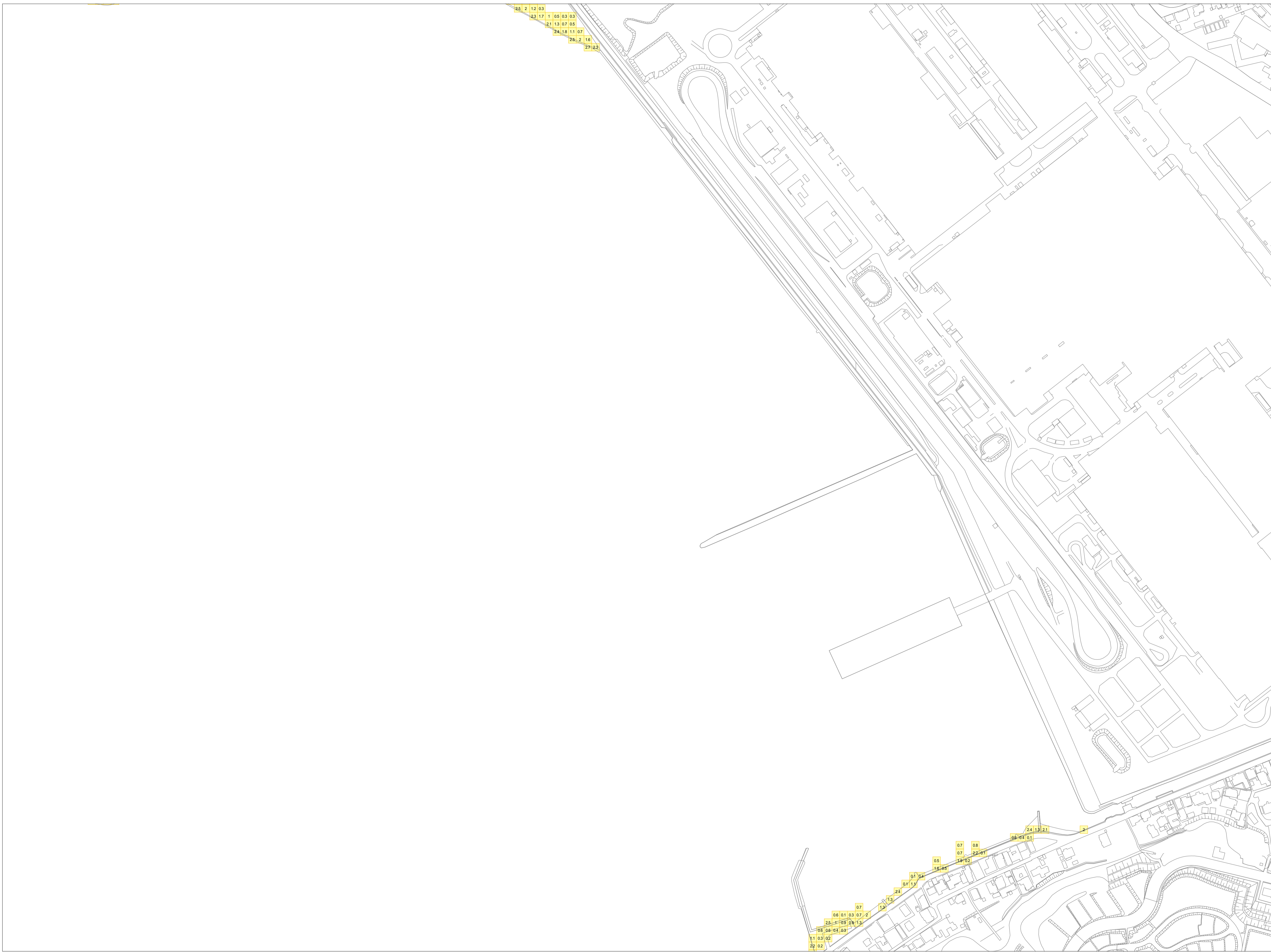
この地図データは、防府市長の承認を得て防府市地形図を使用したものである。