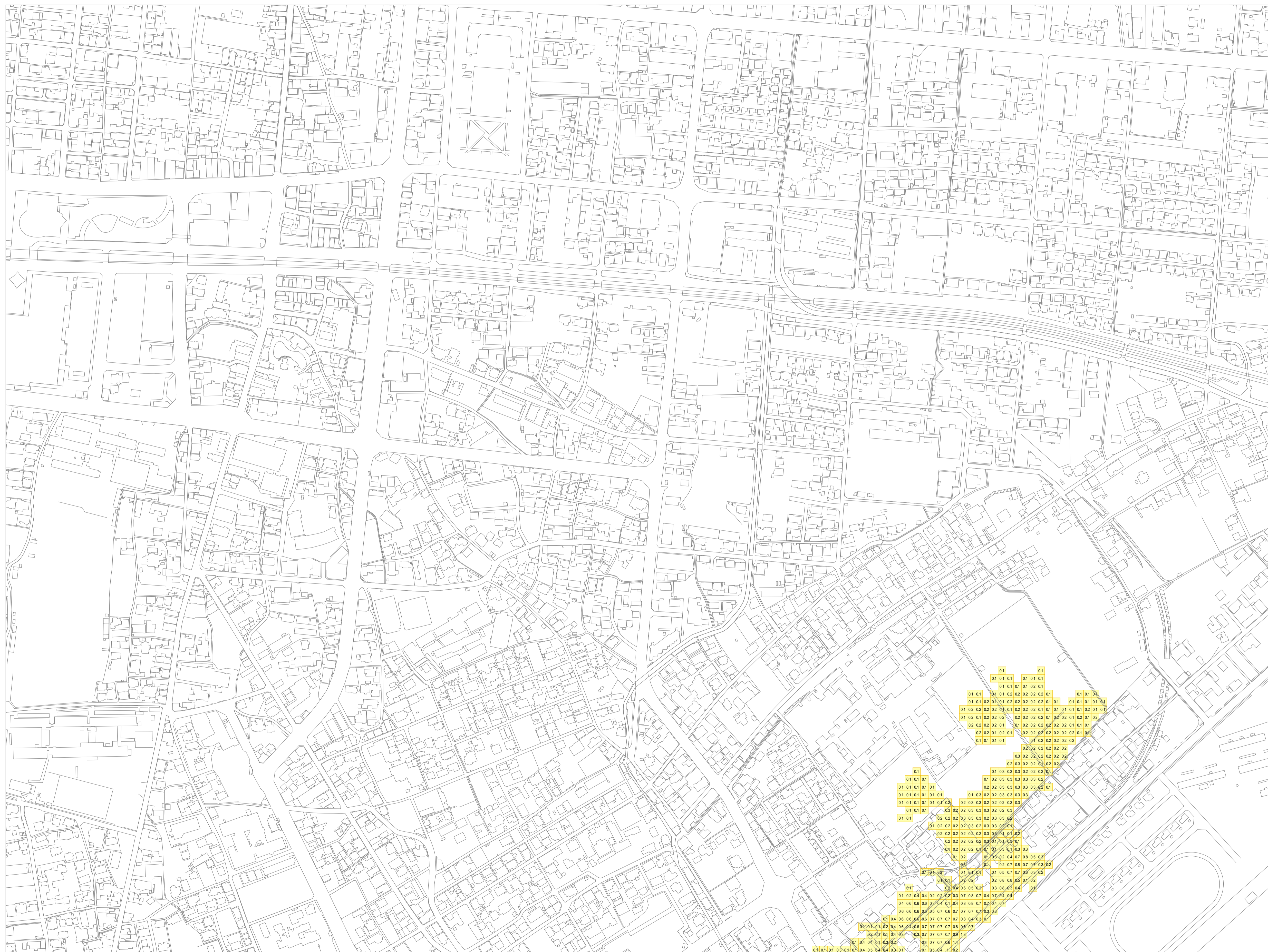
この地図データは、防府市長の承認を得て防府市地形図を使用したものである。