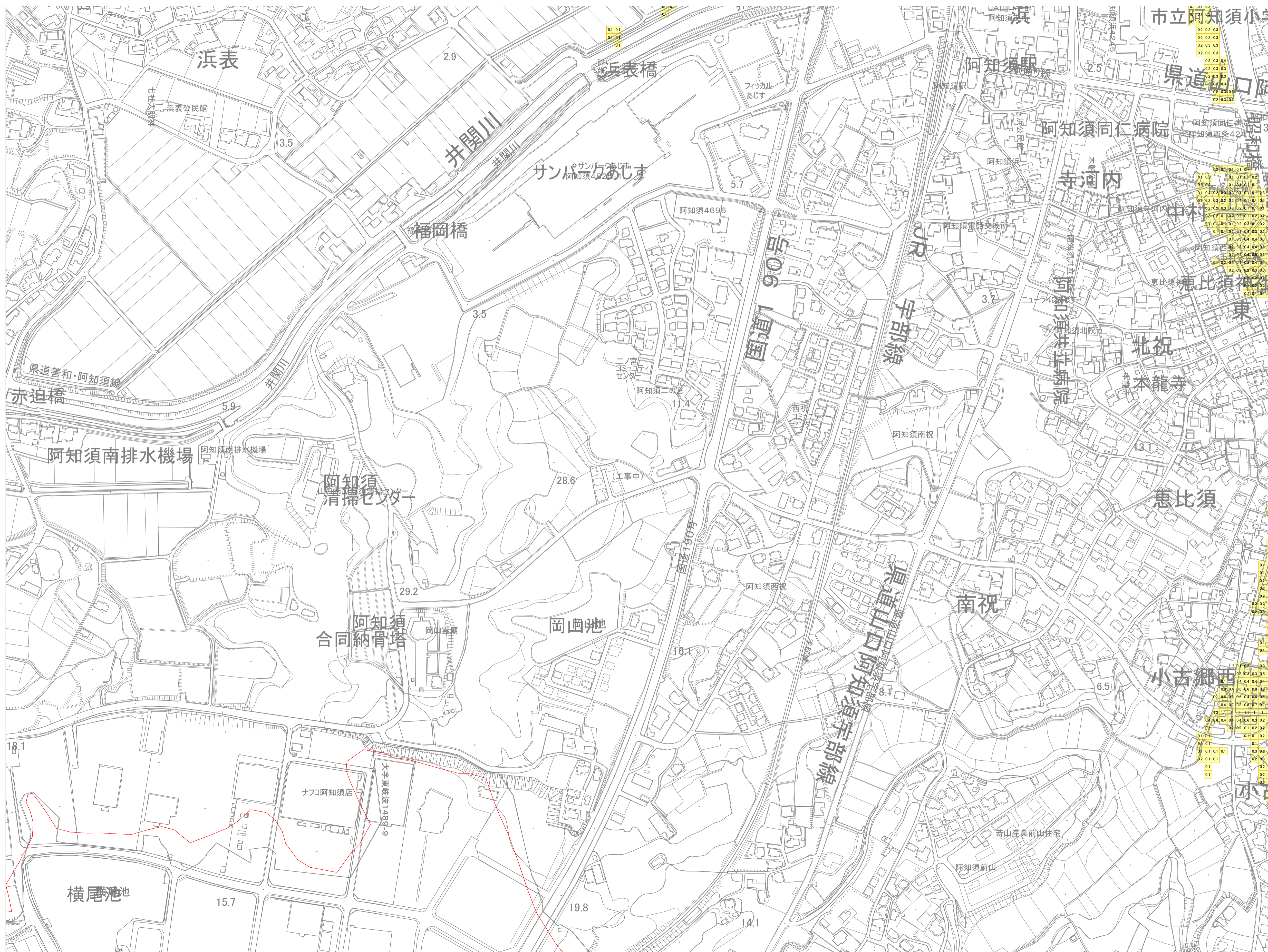
この地図は、山口市長の承認を得て、同市発行の山口市都市計画図を複製したものです。(承認番号 平成25年12月2日 都第177号)