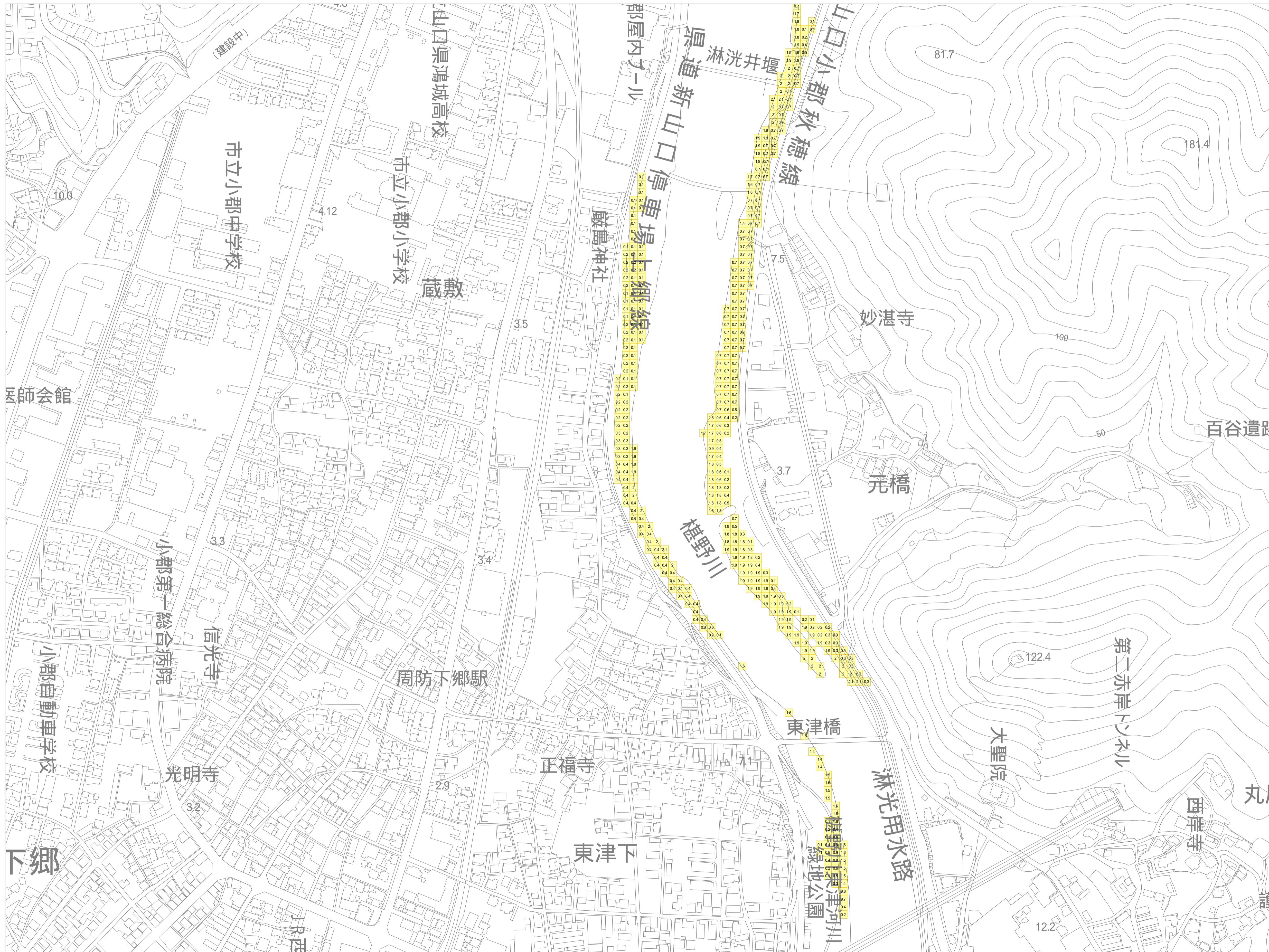
この地図は、山口市長の承認を得て、同市発行の山口市都市計画図を複製したものです。(承認番号 平成25年12月2日 都第177号)