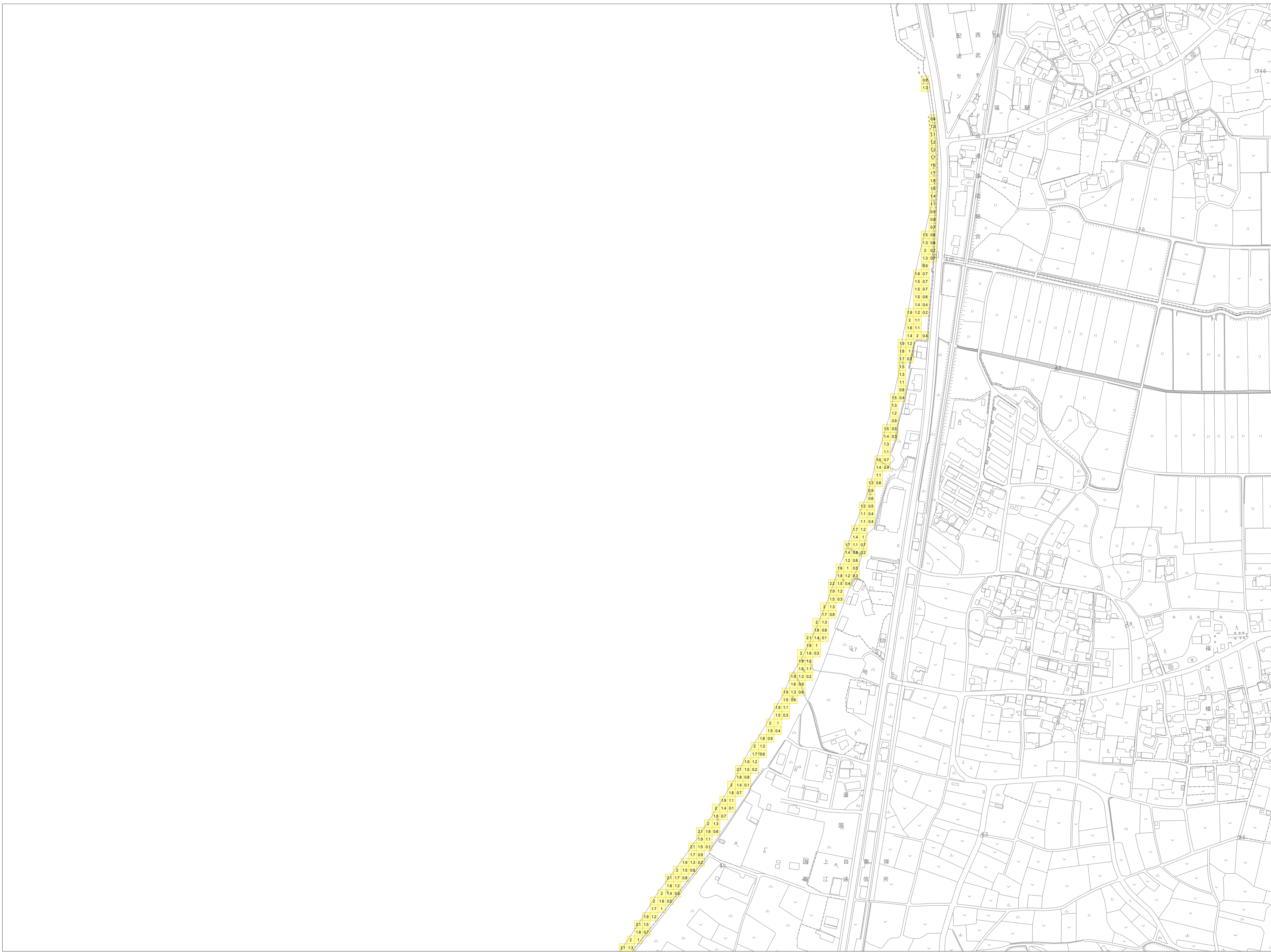
この地図の作成に当たっては、下関市長の承認を得て、同市発行の都市計画図を使用したものである。(承認番号 下都第1508号)