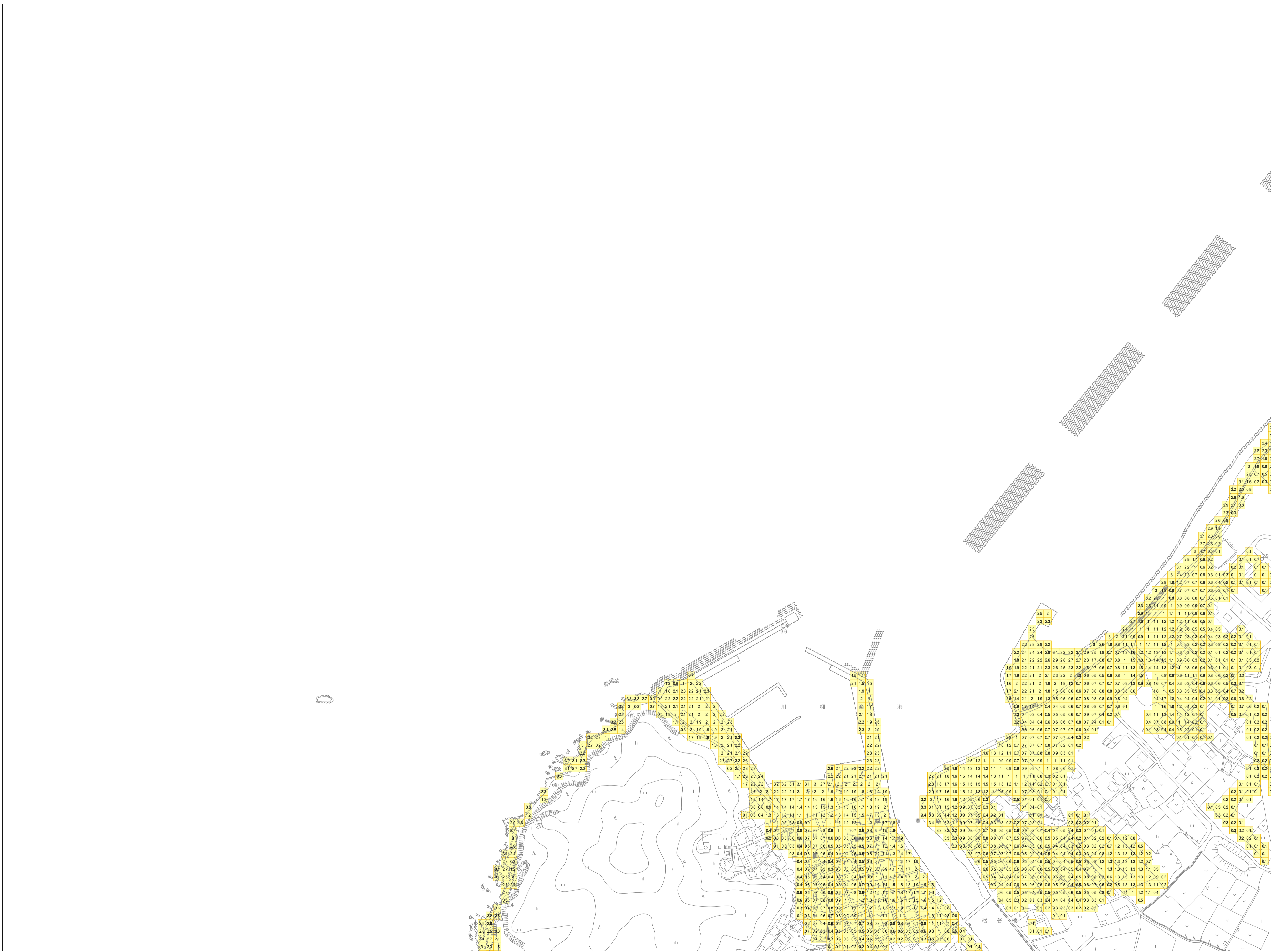
この地図の作成に当たっては、下関市長の承認を得て、同市発行の都市計画図を使用したものである。(承認番号 下都第1508号)