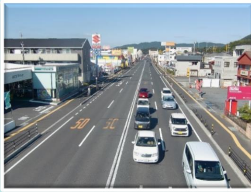
国道188号 光市 平成29年6月完成