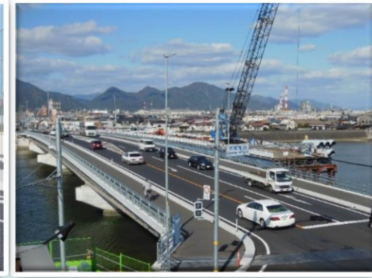
国道2号 栄橋 岩国市 平成29年3月完成