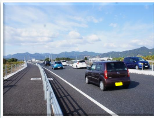
国道2号 小月バイパス 下関市 平成29年4月完成