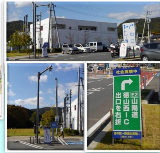
道の駅「ソレーネ周南」周南市 平成29年7月15日利用開始