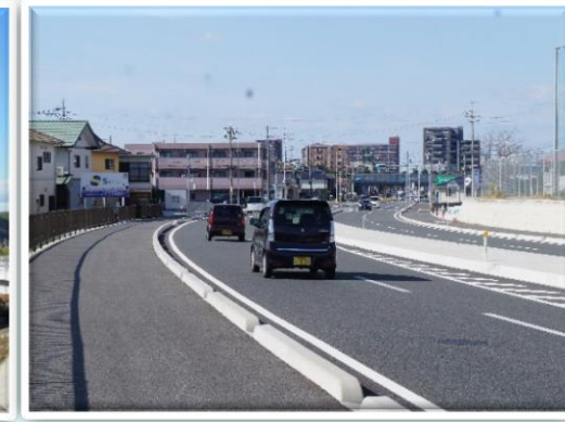
県道田倉新下関停車場線 下関市 (都市計画道路長府綾羅木線) 平成28年5月完成