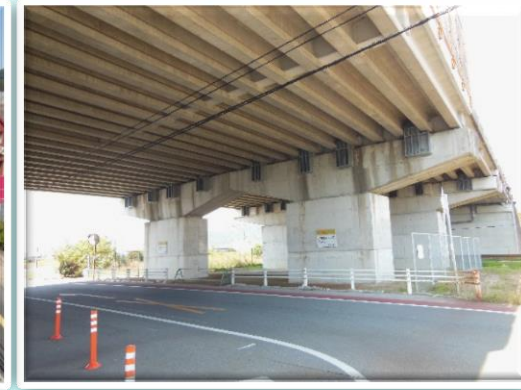
県道中ノ関港線 植松大橋 防府市 平成29年3月完成