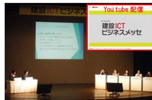
トップランナーによるパネルディスカッション