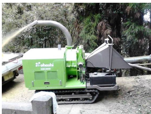
【自走式木材粉碎機購入 (中型)】 (岩国市)