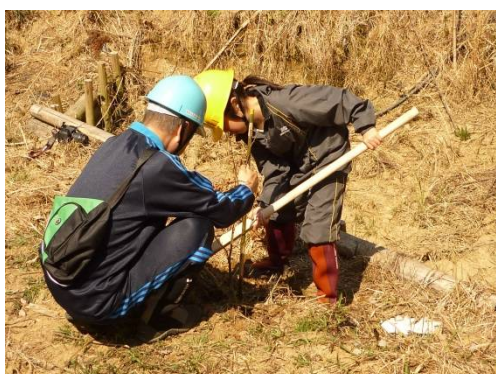
【柳井ふれあい森の会】 (柳井市)