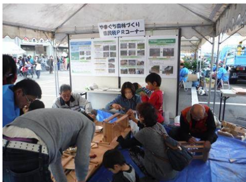
【美秋林業まつり（美祢市）】