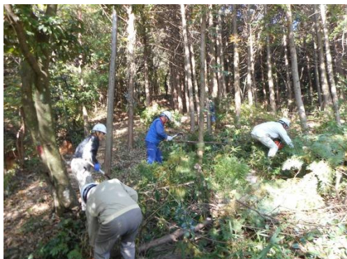
【海北迫窯・木・竹炭クラブ】 (防府市)