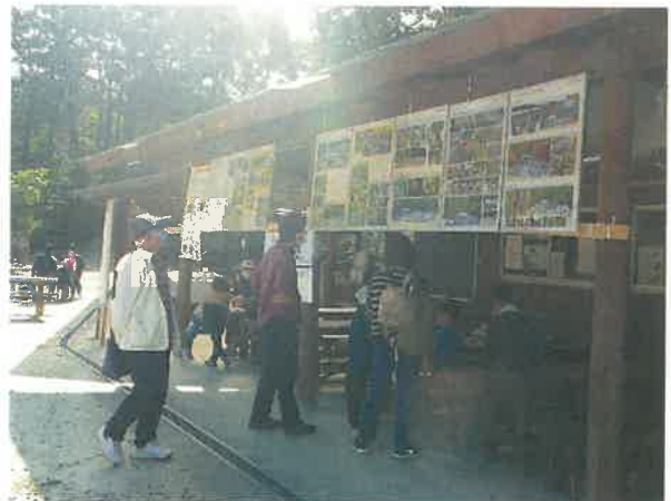
【まちと森と水の交流会（周南市）】