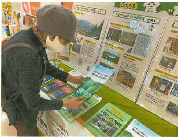
【むら、まち交流フェア（宇部市）】