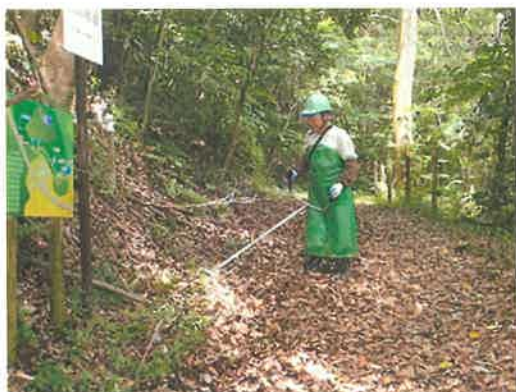
【竹林ボランティア防府】 (防府市)