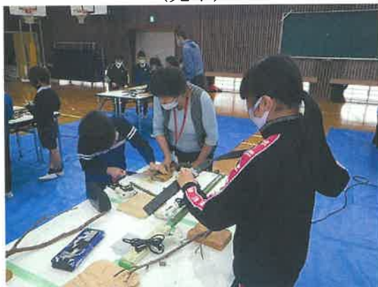
【光市林業研究会】 (光市)