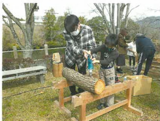
【森林・里山づくり研究会】 (岩国市)