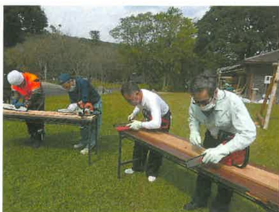
【チェーンソー、刈払機技術研修】