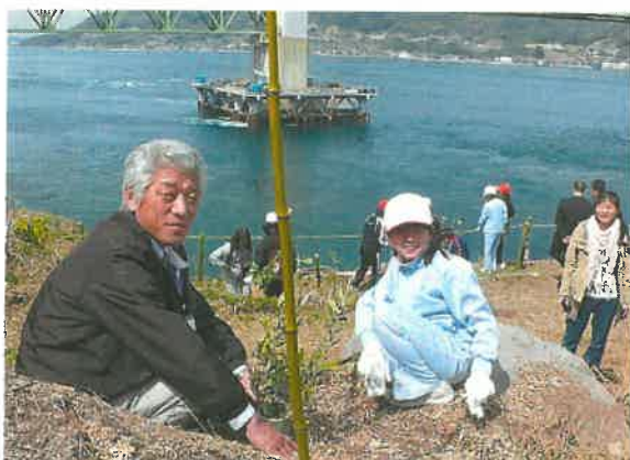
【美しい三浦を創る会】 (周防大島町)