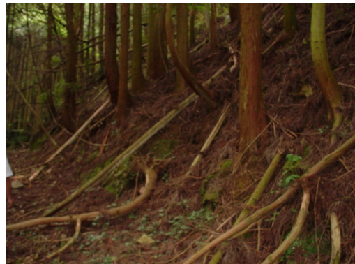
長期間放置され荒廃した森林（下草が枯れ、表土が流出し、樹木の根が露出している。）

近年、農山村の過疎化や高齢化、担い手の減少、また木材価格の長期低迷など林業を取り巻く経営環境の厳しさが増す中で、人工林を中心に荒廃した森林が増加し、水源のかん養や県土の保全など県民生活と密接に関わる森林の多面的な機能の発揮が懸念される状況となっています。この多面的機能の回復を図るため、