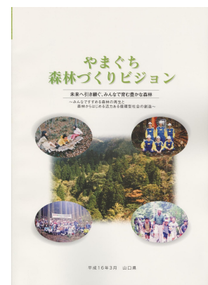
やまぐち森林づくりビジョン (平成16年3月策定)

このビジョンでは、百年先の豊かな森林の創造に向け、人と森林の関わり方を考慮して、本県の民有林を「自然を守る森林」、「水と緑を育む森林」、「循環利用される森林」、「生