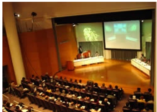
やまぐち森林づくりシンポジウムの開催(平成17年1月30日)

県では、財源検討委員会の報告を受けて、「やまぐち森林づくり県民税(案)」を公表しました。テレビやラジオ、県のホームページなど各種広報媒体を活用した広報活動、県内10箇所での県民説明会、森林シンポジウムの開催などによる周知を行うとともに、パブリックコメントやシンポジウムの実施時のアンケート調査など幅広い意見の聴取に努め、また、県議会での審議を経て、平成17年4月から「やまぐち森林づくり県民税」を導入することが決まりました。