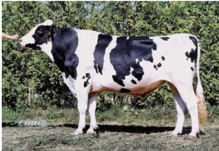
JP3H51676 タイタニックの娘