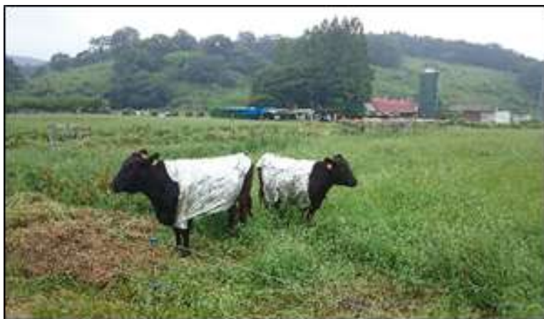
図 1 牛衣の着用状況 (遮光素材区)