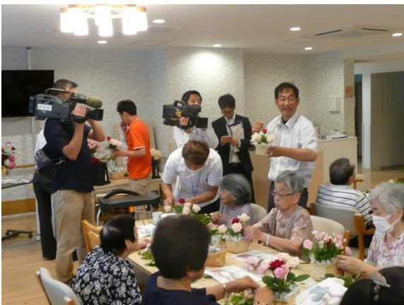
【バラ生産者によるアレンジメント教室】

下関農林事務所農業部では、花の生産振興と併せ、消費拡大についても、関係機関と連携して支援を行っていくこととしています。