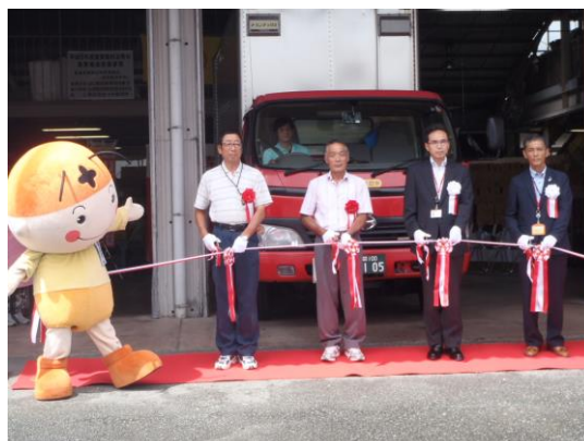
テープカットの様子