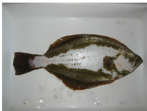
図 3 無眼側に色素が現れているヒラメ

なお、種苗生産から中間育成時において、本来色素の付かない無眼側に色素が現れる体色異常が起こる(図 3)。成長してもこれらは消えないので、市場調査等において放流魚の判断指標として利用しており、調査尾数に占める体色異常魚の割合から混入率を算定している。