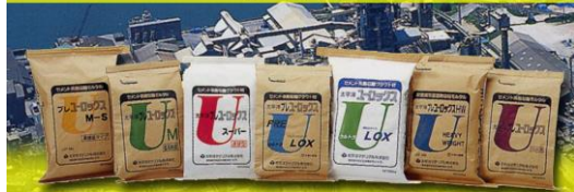
セメント系無収縮材