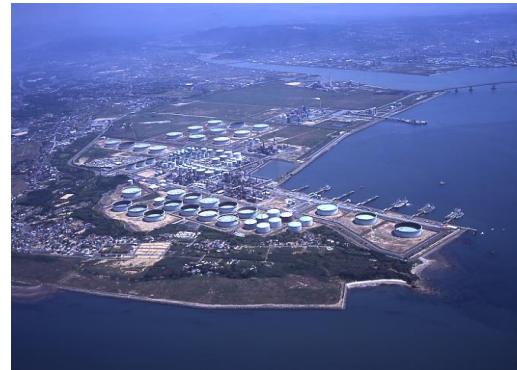
西部石油(株)山口製油所 全景

当事業所では、原油を原料とし、蒸留・改質・精製等の製造工程を経て、年間600万KLの石油製品及び石油化学原料の生産を行っておりますが、各種の精製装置を集約・連結した集中合理化設備により、世界のシェルグループ30数製油所の中でも、最高レベルの省エネ型製油所となっております。