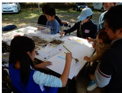
*ヨシの筆でクラフトアート*