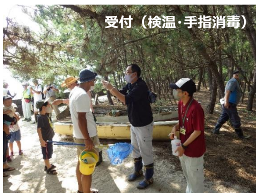
受付(検温・手指消毒)