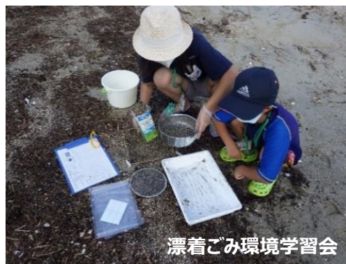
漂着ごみ環境学習会