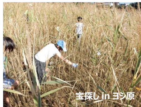
宝探し in ヨシ原