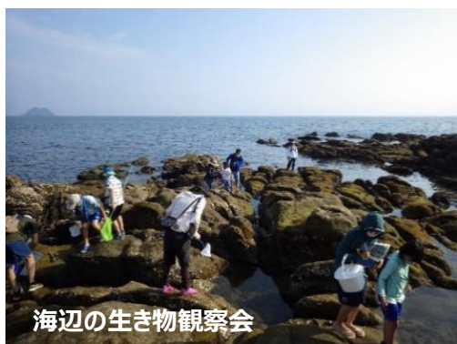
海辺の生き物観察会