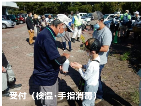
受付（検温・手指消毒）