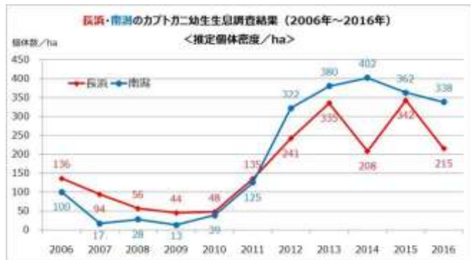
図4 カプトガニ幼生の推定個体密度

平成 24 年度以降、南潟の個体密度が長浜よりも多くなっており、干潟底質の変化等の影響が示唆されるが、明確な理由は明らかとなっていない。