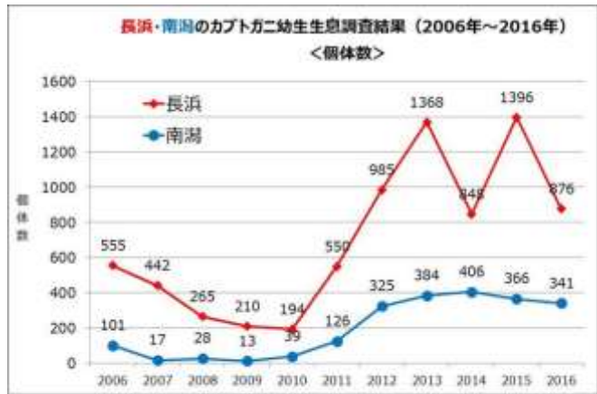
図3 カプトガニ幼生の確認個体数

平成 18 年度から平成 22 年度までは徐々に減少していたが、平成 23 年度から増加傾向にある。平成 28 年度は、昨年度に比べて減少したが、どちらの調査区においても過去 11 年間の調査で、4 番目に多い個体数であった。