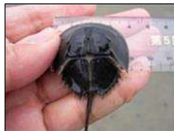
図 2 カブトガニ幼生の前体幅の計測