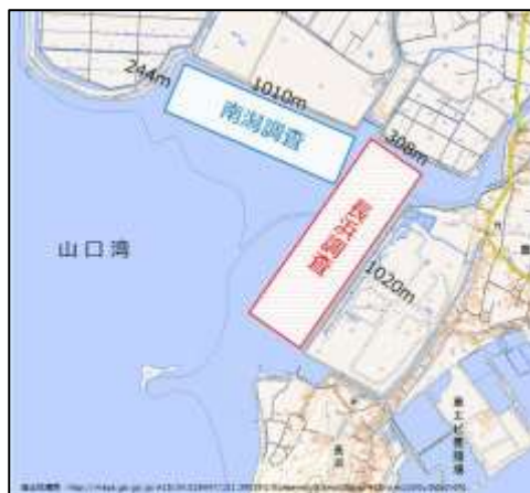
図 1 カブトガニ幼生生息調査場所