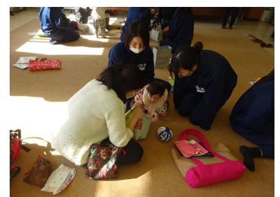
（ふれあい体験の様子）