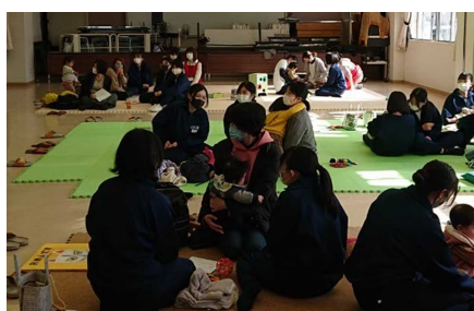
（ふれあい体験の様子）