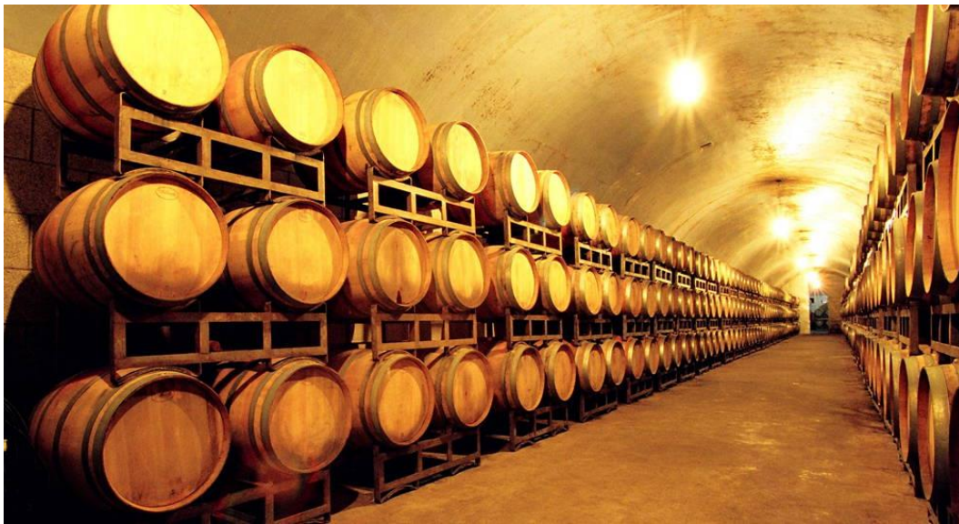
張裕酒文化博物館

また、煙台は中国八大料理—山東料理（魯菜）の発祥地、アジア唯一の国際葡萄・ワインシティ、世界七大葡萄海岸の一つでもあり、1892年に創業した張裕、長城、威竜等のワインブランド企業があります。