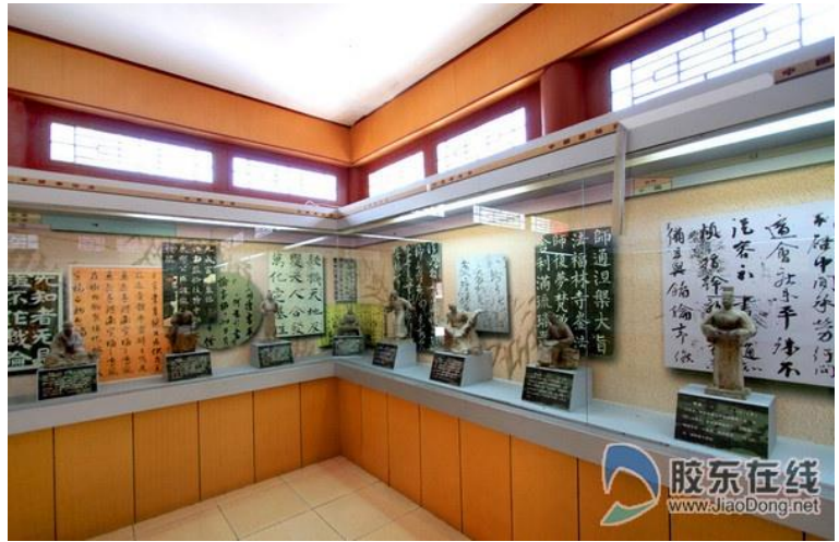
雲峰山（文峰山）魏碑石刻