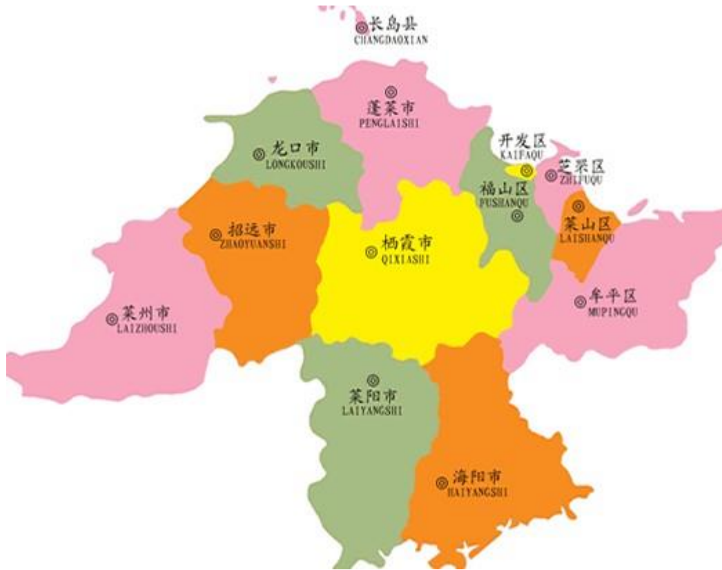
煙台市行政区画図