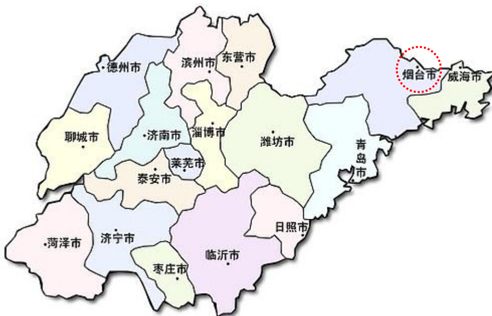
山東省行政区画図

煙台市（えんたいし、中国語:烟台市、英語:Yantai）は中国山東省東部に位置する都市です。山東半島の北海岸を占め、渤海湾に面し、東は威海に、南と西は青島にそれぞれ接しています。遼東半島及び日本、韓国と海を隔てて向き合っています。管轄地域は4つの区、1つの県と7つの県レベルの市、その他対外開放区などが4つあります。面積は13745.95平方キロメートルで、人口は708.94万（2017年末時点）です。