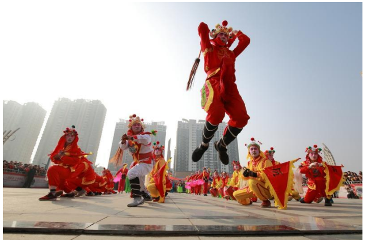
海陽市のヤンコ踊り

煙台市は中国で著名な「京劇の郷」、「陸上競技の里」で、「八仙過海伝説」など多くの項目が国家非物質文化遺産目録に登録されました。その中でも、海陽市のヤンコ踊りは 29 回北京オリンピックのメインスタジアム鳥の巣でも披露されました。