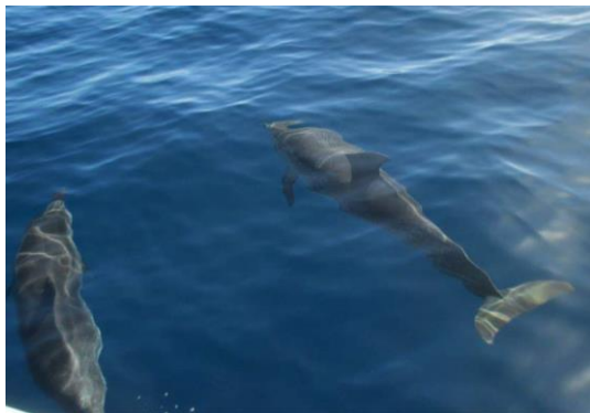
イルカ発見ツアー

一年中の平均気温が20度で有名なカナリア諸島は特に冬の時期ヨーロッパ人の間で有名な観光地です。12月から2月までの時期を含めて海で泳ぐ人はたくさんいて、島の南側には常春の雰囲気があります。海が好きな人は冬でもカヌーエクサカーション、ウインドサーフィン、野生イルカ発見ツアーを体験できます。一方、山が好きな人は色々な素敵なハイキングトレールに挑戦できます：2月のアーモンド木の開花の時がお勧めです。