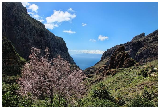
テネリフェ島マスカ谷