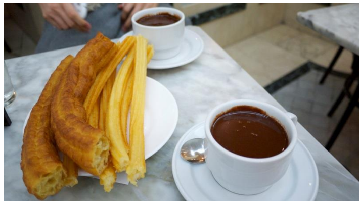
チュロス専門店の「サン・ヒネス」