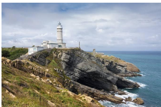
カボ・マジョルの灯台

今まで山のスポットが多かったが、海に面しているサンタンデール市も冬の間とても素敵です。街中で雪が降った時に真っ白になった海辺を眺められるのも一つの魅力です。リオ・デ・ラ・ピラのケーブルカーに乗ったら、サンタンデール第一カンタブリア海の絶景を見逃してはいけません。それに、歴史が好きな人はサンタンデール市中心部から車で30分ぐらい離れたところにある旧石器時代末期に描かれたアルタミーラ洞窟壁画が非常にお勧めです。一方、動物が好きな人にはサンタンデール市中心部から20分離れたところにある、世界各地からやってきた放し飼いの動物がたくさんいるカバルセノのサファリは忘れられない思い出になると思います！