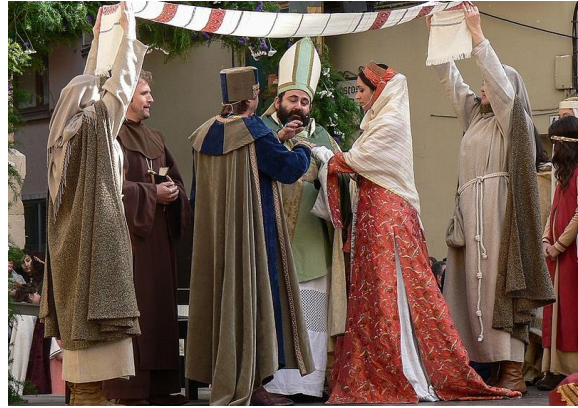
テルエルの恋人たちの再現