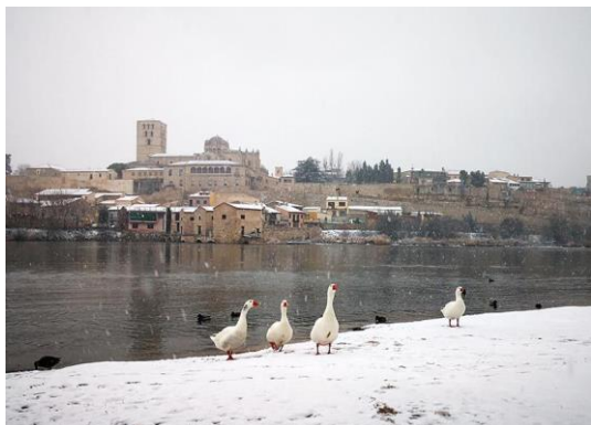
ドゥエロ川から見たサモラ市の風景

番年上の女性に渡します。地元の文化的な団体の女性は伝統衣装を纏って、町中で伝統舞踊を踊ったり、演奏をしたりして、町中がお祭りになります。