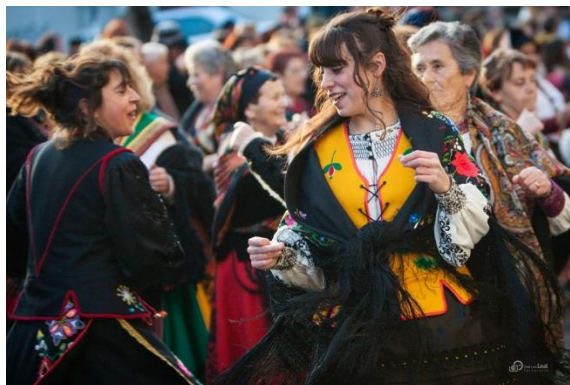
アゲダ祭りの様子