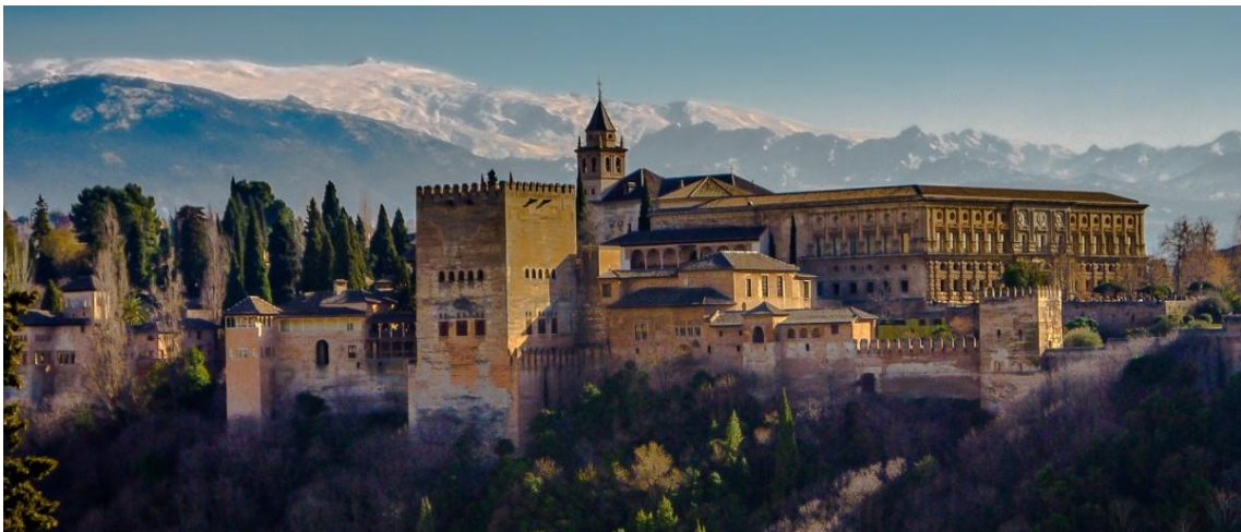
アルハンブラ宮殿

スペイン南部にあるグラナダ市は世界遺産のアルハンブラ宮殿や綺麗な街並み でとても有名ですが、真夏の最高気温は40度を超えても、冬はシエラネバダ山 脈のあたりで雪が降ることもあります。町はとても人気の観光地なので、特に 春と夏に大変込み合っていますが、冬は人が少なく、物価がもう少し安くな ります。それに、グラナダ市の有名な観光地の間は、それほど長い距離が離れ ていませので、散歩しながら旧市街、アルハンブラ宮殿、グラナダ大聖堂を ゆっくりで楽しめます。