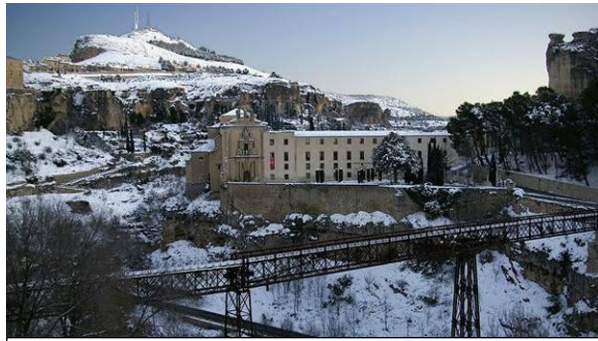
サン・パブロ橋からの冬景色