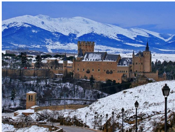
セゴビア市の水道橋とお城のアルカサル