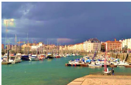
サンタンデール市の港