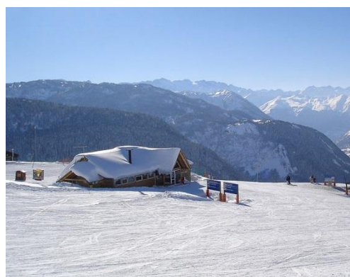
ビエジャ市とアラン谷の様子