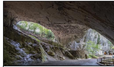
スガラムルディ洞窟

映画のネタになったこの伝説の舞台は山口県の姉妹提携先であるナバラ州です。フランスの国境から3キロ離れている220人の村にある洞窟では、昔魔女の集まり「Akelarre」（アケラーレ）が開催されていたと信じられていました。