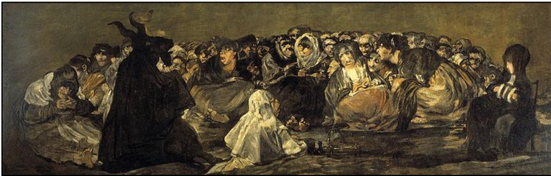
「El akelarre」スペインの画家ゴヤによる魔女の集まりの様子

現在スガラムルディの洞窟は観光地になっていて、綺麗な自然に囲まれながら魔女たちの伝説について学べます。