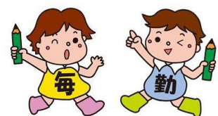
毎月勤労統計調査のキャラクター「まいちゃんきんちゃん」

http://www.pref.yamaguchi.lg.jp/cms/a12500/tingin/maikin.html