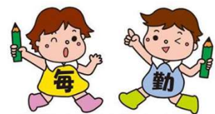
毎月勤労統計調査のキャラクター「まいちゃんきんちゃん」

https://www.pref.yamaguchi.lg.jp/cms/a12500/tingin/maikin.html