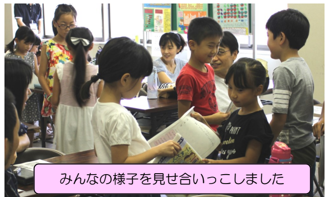
みんなの様子を見せ合いっこしました