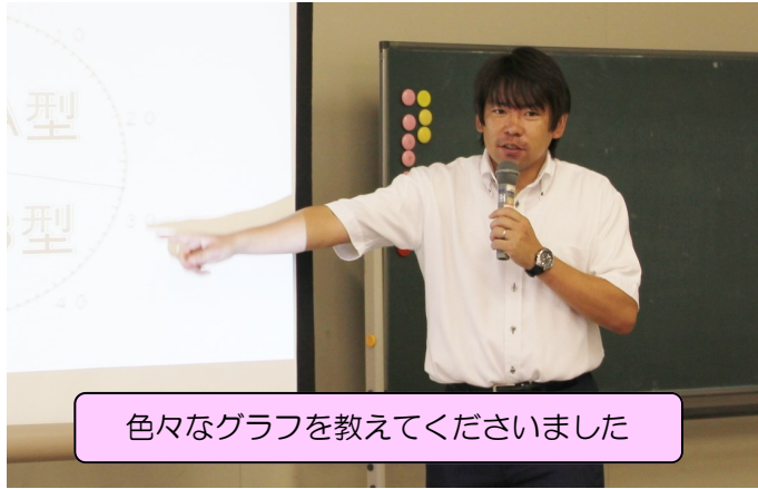
色々なグラフを教えてくださいました