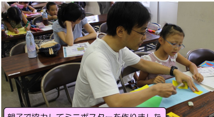
親子で協力してミニポスターを作りました