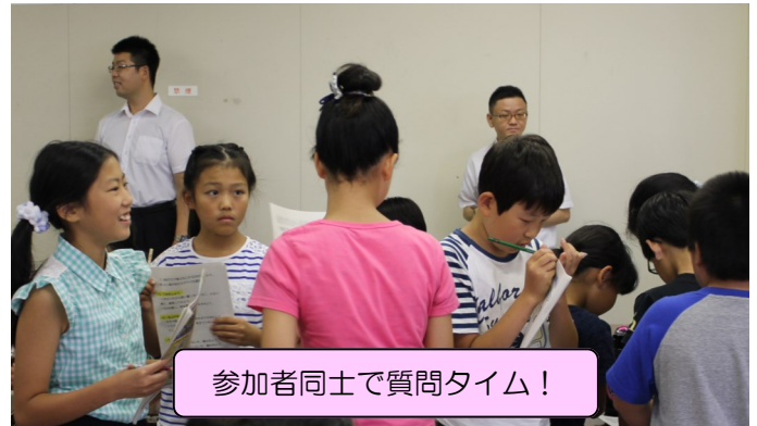
参加者同士で質問タイム！