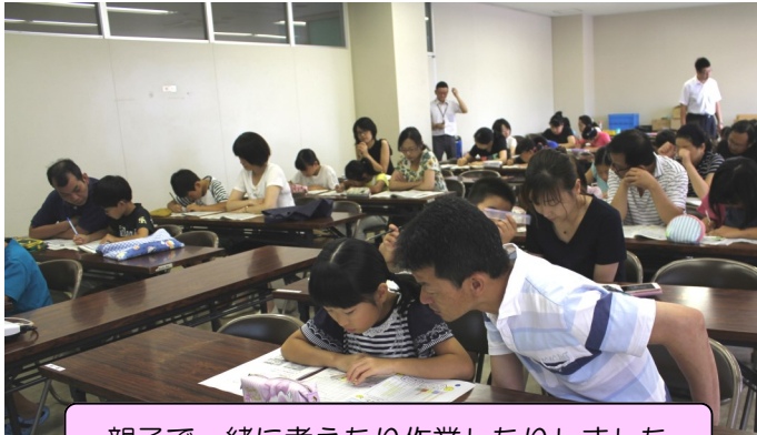
親子で一緒に考えたり作業したりしました

参加者同士でアンケートをとって、色画用紙を台紙にしてミニポスター作りなどを行いました。