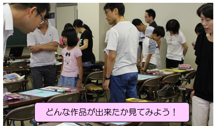
どんな作品が出来たか見てみよう！