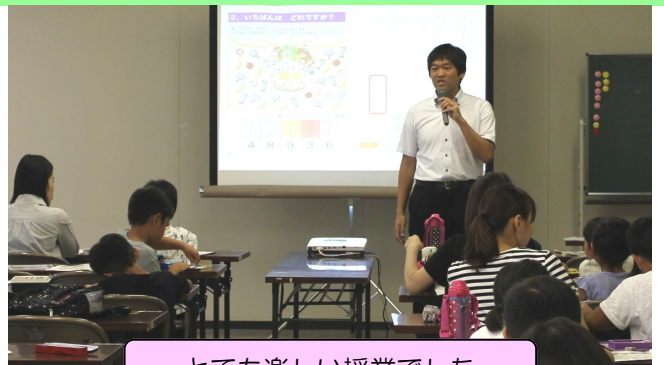
とても楽しい授業でした

上手なグラフの書き方を習い、絵グラフの書き方や統計のあらわし方を練習して、親子で協力してミニポスターを作りました。