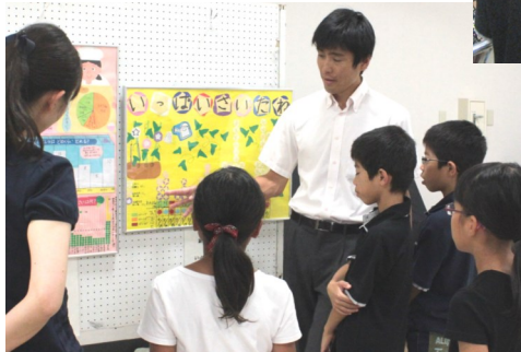
昨年の作品を見て、グラフを作るとき注意点や工夫しているポイントを教わりました。