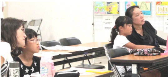
親子でグラフを見てわかったことや隠されているトリックを話し合っ、そのことを発表しました。