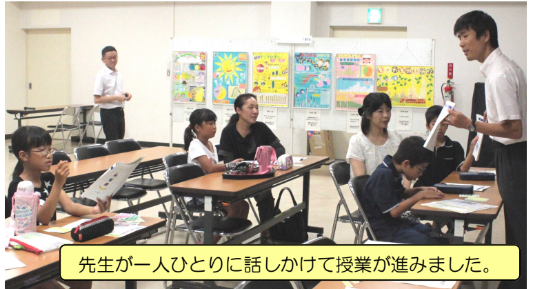
先生が一人ひとりに話しかけて授業が進みました。