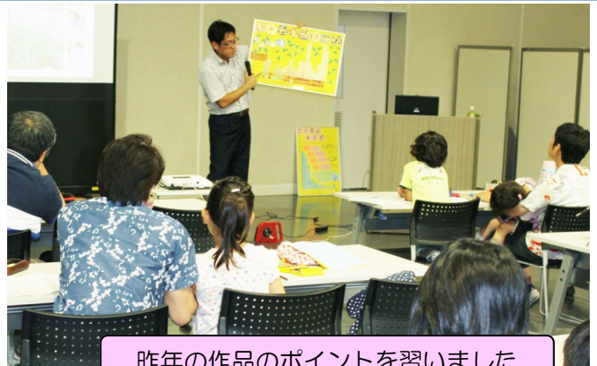
昨年の作品のポイントを習いました