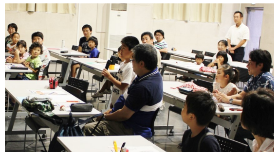
ちょっと恥ずかしかったけど頑張りました！