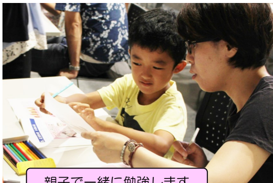
親子で一緒に勉強します