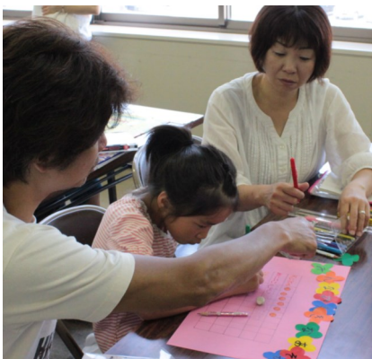
親子で協力してミニポスターを作りました