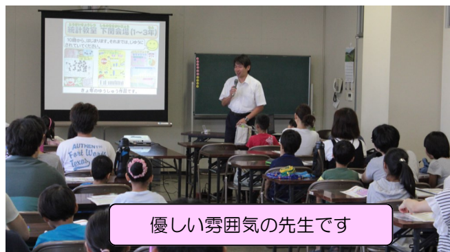
優しい雰囲気先生です

上手なグラフの書き方を習い、絵グラフの書き方やとうけいのあらわし方を練習して、ミニポスターをつくりました。