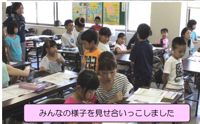
みんなの様子を見せ合いっこしました