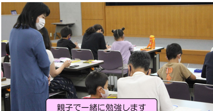
親子で一緒に勉強します