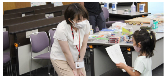
会場にいる全員に質問したよ