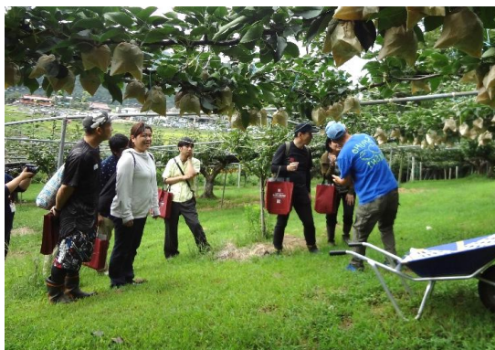
産地見学ツアーの開催

青年同志会が中心となってSNSで産地情報を継続的に発信する仕組みを整備し、実践できた。積極的な担い手確保の取組に対する意識が向上し、主体的な新規就農者募集ポスターの作成・配布に繋がった。また、担い手確保・育成に関する先進地視察の実施により、新規就農者の受入体制の整備に向けて機運が高まった。