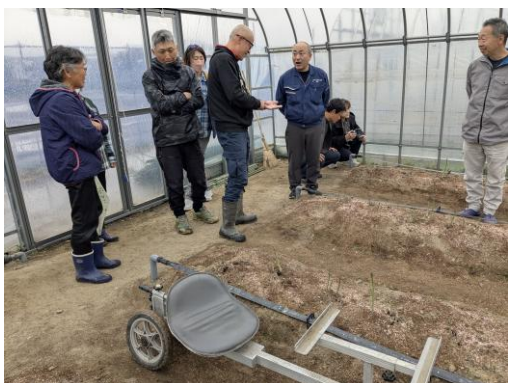
新規就農者ハウスにおける現地研修会

新規栽培に対応した栽培暦の作成では、ベテラン生産者への聞き取りを通じて、特に1年目のほ場づくりに関する重要性やポイントを整理・明確化することができた。また、施肥設計については、土壌分析の結果、肥料の過剰投入となっているハウスが多いことが明らかとなったため、残存窒素の動向を見つつ見直していく方針を確認できた。