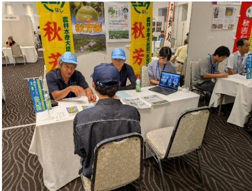
新規就業ガイダンスへの出展