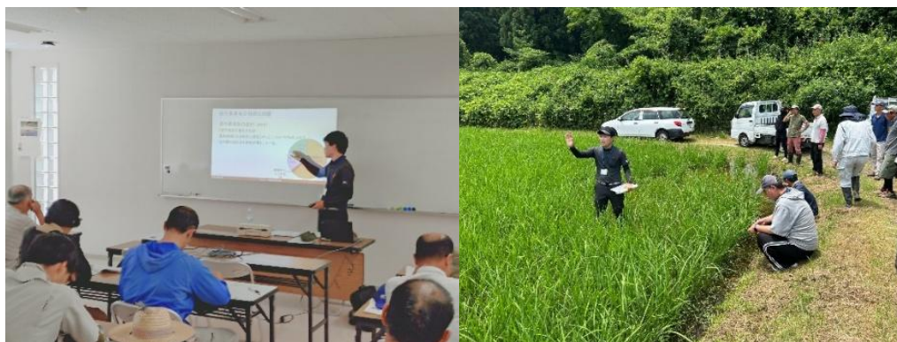
写真1 水稻基礎研修での説明の様子