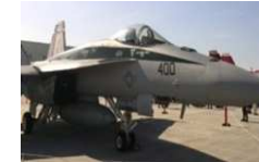
FA-18E/F スーパーホーネット 戦闘攻撃機