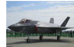
F-35B F-35C ライトニングII 戦闘機