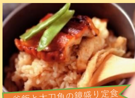
釜飯と太刀魚の鏡盛り定食