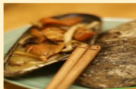
瀬戸貝の釜飯セット (※写真は瀬戸貝焼)