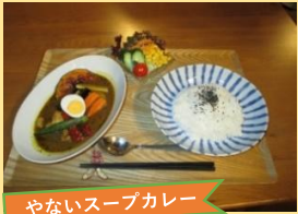
やないろスープカレー