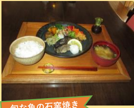
旬な魚の石窯焼き