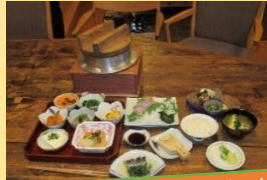
地物魚介類と地物野菜と羽釜炊きのお米の料理