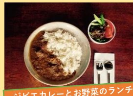
ジビエカレーとお野菜のランチ