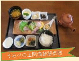
うみべの上関漁師飯御膳