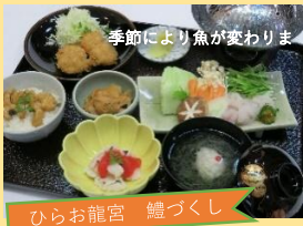
ひらお龍宮 鱧づくし