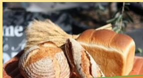
県産小麦「せときらら」を使ったパン

国産小麦、県産小麦を主に使用し、 旬の野菜や果物を使った多種多様な 商品を製造販売しています。