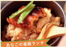
あなごの釜飯ランチ