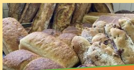
当店のパンはすべて山口県産小麦 100%使用しています

身体に良いもの、新鮮なもの、思いを 込めて作られたものを追求したパン 作りにこだわっています。