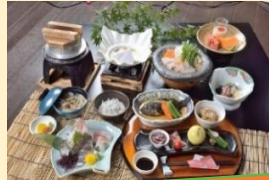
会席料理 (1泊2食付き、料理は季節によって変更)