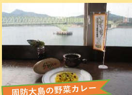
周防大島の野菜カレー