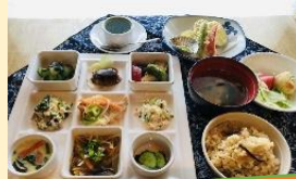
手づくりこだわった新鮮野菜料理