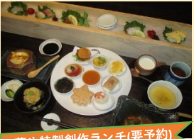
蔵や特製創作ランチ(要予約)