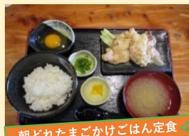
朝どれたまごかけごはん定食