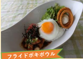
フライドポキボウル