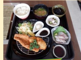
ミックスフライ定食