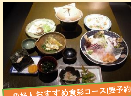
魚好人おすすめ食彩コース(要予約2名様~)