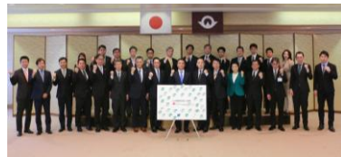
令和7年度第1回山口県 コンビナート連携会議

★国の「GX戦略地域」選定に向け、コンビナート企業が検討を進めている新事業の事業可能性調査を支援