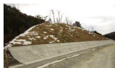
グリーンフォーマットT-50

山林の整備で発生した間伐材を木毛状に加工し、植生基材マットの原材料として再生利用した製品です。間伐材は天然由来の循環資源であり、安全面での懸念がありません。