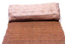
グリーンフォーマットメガタイプ