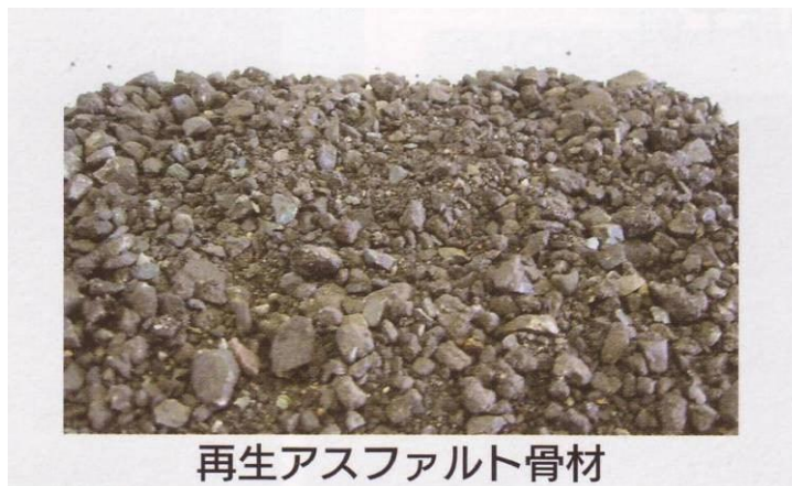
再生アスファルト骨材

アスファルト舗装打換え工事や管布設工事等により発生するアスファルトコンクリートがらを破碎・選別した製品です。