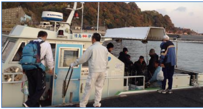
〔釣り客で賑わう早朝便〕