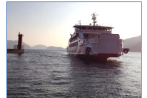
〔フェリーしらきさん〕

陸奥記念館やなぎさ水族館、陸奥野営場などが整備されており、家族で楽しむことができます。