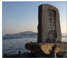
〔ふたば海難慰霊之碑〕

昭和51年、情島沖で貨物船と衝突事故を起こし沈没したフェリー「ふたば」の犠牲者の慰霊碑が島の東側の海峡を望む位置に建てられています。