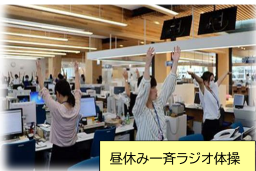
昼休み一斉ラジオ体操