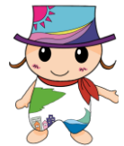
「生涯『健幸』なまち」ながとイメージキャラクター“さっちゃん”

事業企画や支援方法に悩む時には、問題解決のための方策を保健師間で共有しています。定期的に事例検討会や勉強会もあるため、保健師としてのスキル向上に繋がります。