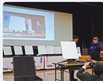
衛星インターネット機器の操作説明会の様子