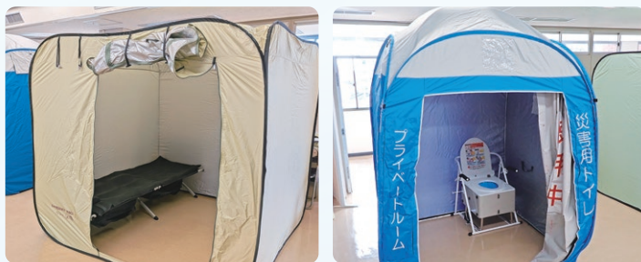
避難所用資機材の例 (簡易ベッド・簡易トイレ・テント式パーティション)

簡易トイレや簡易ベッド、テント式パーティション等の資機材を各地域に整備するとともに、必要に応じて市町へ貸し出しを行うことにより、各市町避難所などへの広域支援体制を構築します。