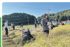
酒米の稲刈り体験(萩市)