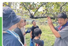
梨園での摘果体験(下関市)