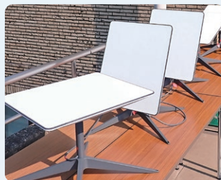
衛星インターネット機器