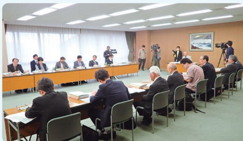
山口県地震・津波防災対策検討委員会の様子

山口県では、令和6年能登半島地震の教訓を、今後起こり得る大規模災害への備えに生かしていくため、「山口県地震・津波防災対策検討委員会」において、 体制 物流 避難 等の区分ごとに課題を抽出し、対応の方向性などを検討してきました。