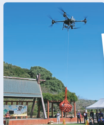
ドローンを活用した物資輸送の実証の様子