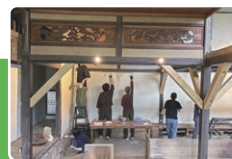
古民家の改修体験(山口市)