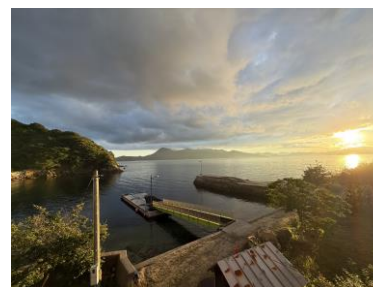
校舎から見た周辺の景色

これまでの教育実践を踏まえ、本校で取り組んでみたいことについて、具体的に述べてください。