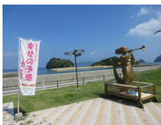
<海洋教育のシンボル>