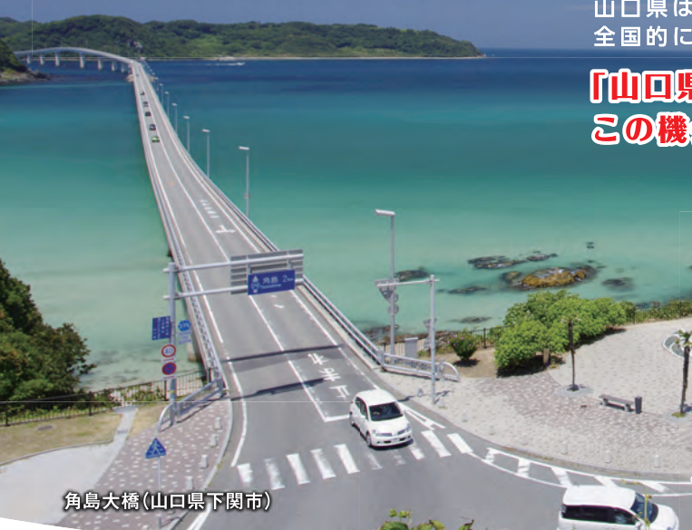
角島大橋(山口県下関市)