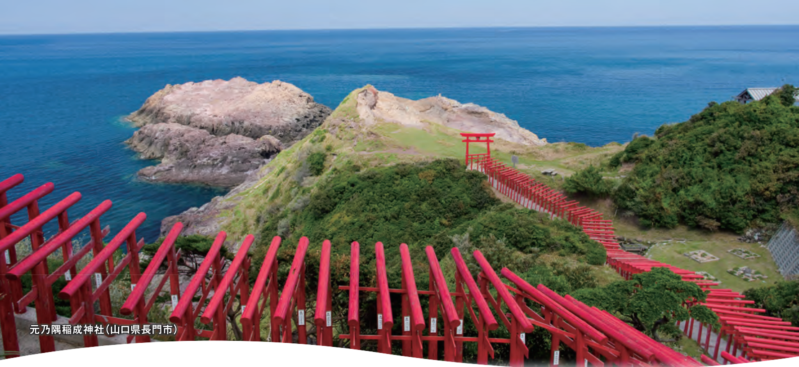
元乃隅稲成神社(山口県長門市)