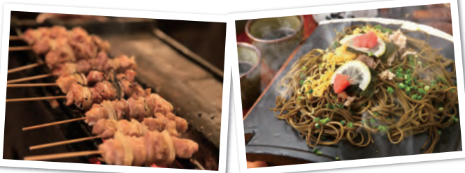
※お皿はセルフサービス

テレビドラマで有名になった瓦そばや長州どりの焼鳥など山口の美味しい特産品をたくさんご用意しています。ぜひ、この機会に数ある山口の特産品を味わってください。