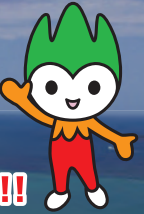
山口県PR本部長 ちよるる

「山口県」が東京フォーラムに1日だけ出現! この機会に、ぜひ山口県に触れてみてください!!