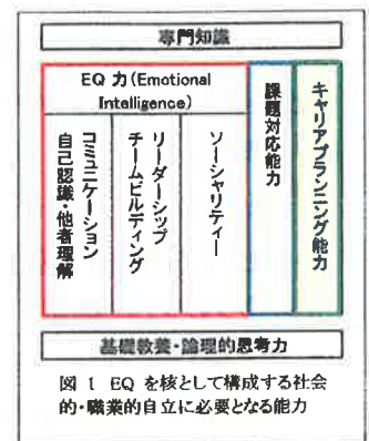
図1 EQを核として構成する社会的・職業的自立に必要な能力