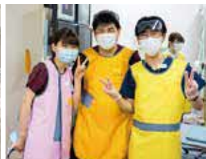
▲呼吸器・感染症内科