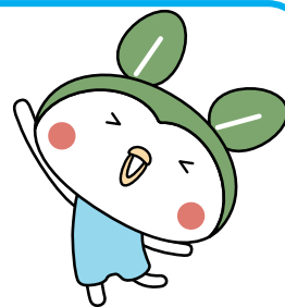
ぶちエコやまくち マスコットキャラクター 「エコっちゃん」

【共催】 山口市 / 防府市 / 美祿市 【協力】 下関市 / 宇部市 / 萩市 / 下松市 / 岩国市 / 光市 / 長門市 / 柳井市 / 周南市 / 山陽小野田市 / 周防大島町 / 和木町 / 上関町 / 田布施町 / 平生町 / 阿武町