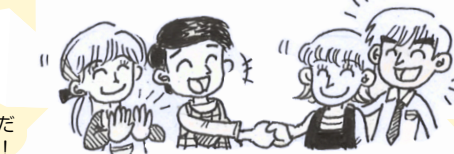
幼児教育・保育施設 家庭